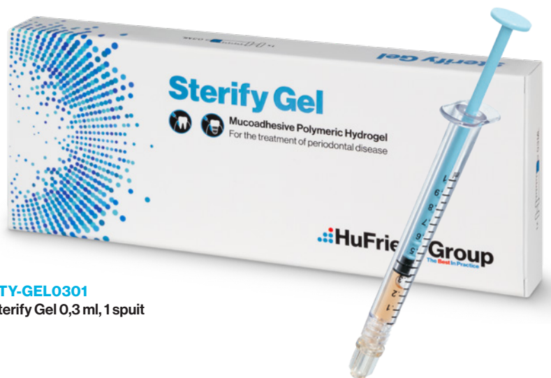
STY-GEL0301 Sterify Gel 0,3 ml, 1 spuit

Begin vandaag nog met het gebruik van Sterify Gel en ervaar het verschil! HuFriedyGroup.eu/es/Sterify-Gel