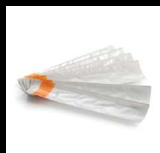
Positionneurs de type brosse à dents Enveloppes hygiéniques