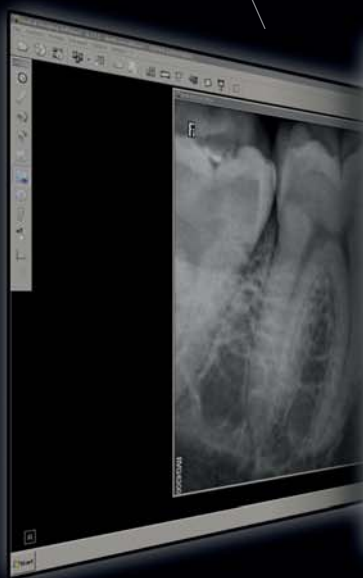
IMAGE NON FILTRÉE